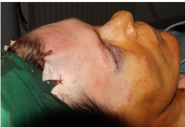
Abb. 2 ◀ Hautüberschuss intraoperativ: Die Stirnhaut wird ohne größere Spannung so weit angehoben, bis die Brauen die gewünschte Position erlangen. Der Hautüberschuss beträgt meist etwa 20 mm und wird exziiert